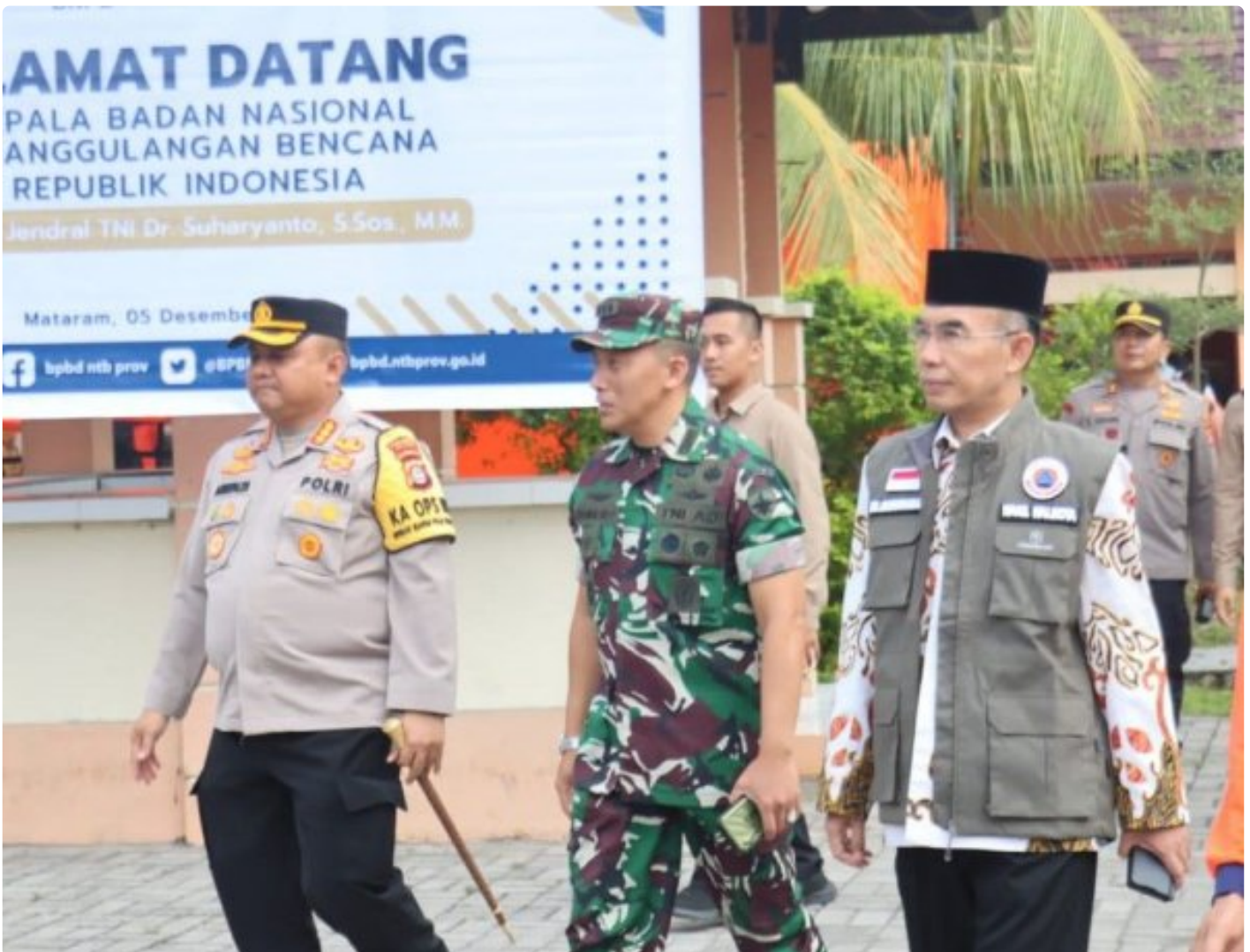
Kapolresta Mataram (Kiri) saat menghadiri acara Peletakan batu Pertama pembangunan gedung Pusdalops BPBD NTB, Kamis (05/12/2024)